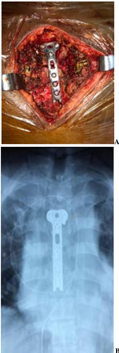
Figure 2 : prise en charge opératoire d'un patient de la série. A : image per opératoire montrant la stabilisation du foyer de fracture par une plaque en T. B : radiographie du thorax montrant une réduction satisfaisante du foyer de fracture.

Le traitement de la fracture sternale était conservateur dans 88,9% des cas (n=8). Un seul patient avait bénéficié d'une ostéosynthèse sternale devant l'instabilité de sa fracture ( figure 2 ). Tous les patients avaient reçu un traitement médical pour la gestion de la douleur fait d'une association paracétamol et néfopam. Nous avons enregistré 1 cas de décès, survenu dans un tableau d'arythmie cardiaque.